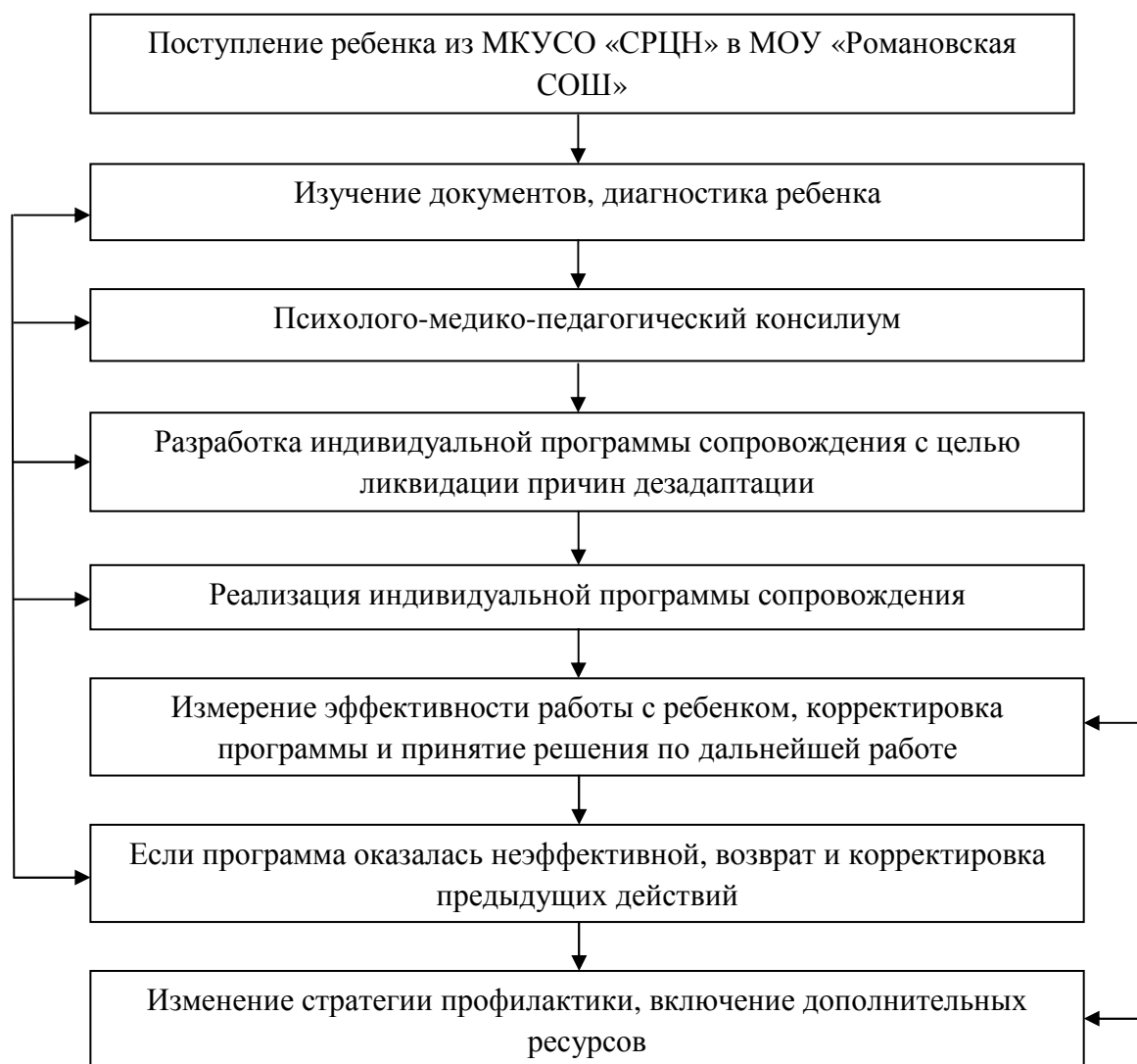
Схема 2. Алгоритм психолого-педагогического сопровождения детей «группы риска».

При составлении индивидуальной программы сопровождения ребенка используем следующую схему: